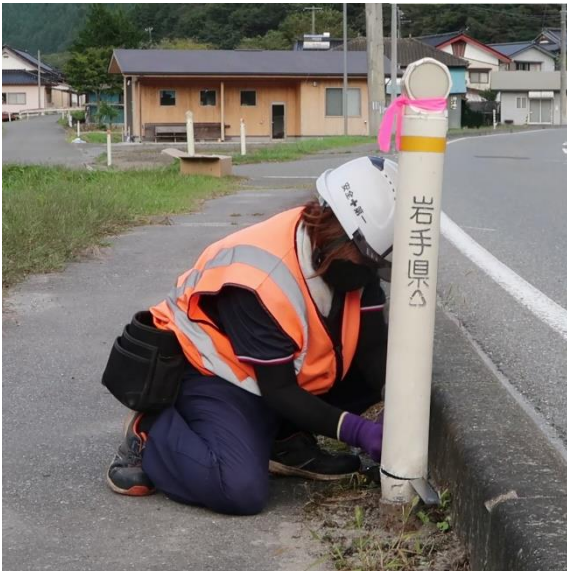
① 既存のデリネーターをカット